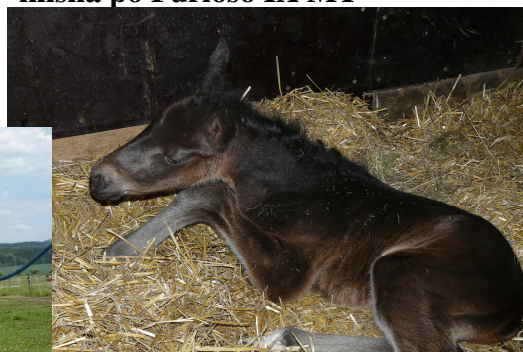
klisna po Furioso IX MT