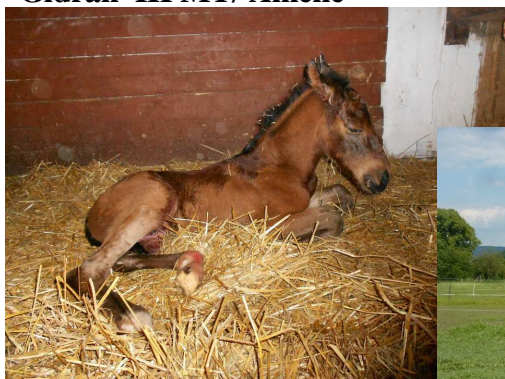
Gidran III MT/ Amélie