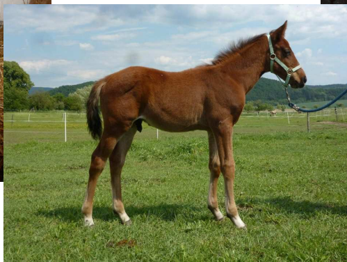
Furiosos III MT/ Sebastian